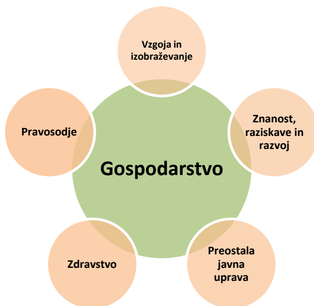
Slika 1: »Roža« povezovanj deležnikov

Vsak deležnik ima svoj pristop k doseganju poslovne odličnosti, kljub temu pa težimo k skupni viziji, v katero je treba usmeriti vse napore, da jo dosežemo oziroma se ji približamo. Zato sta ključna tesno povezovanje in sodelovanje različnih deležnikov javnega in gospodarskega sektorja, ki bodo skupaj lahko prispevali k večji konkurenčnosti našega gospodarstva.